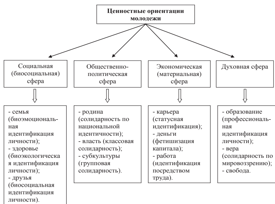
Рис. 1. Ценностные ориентации молодежи

Примечательно, что, по мнению экспертов, стремление к карьере и получению дохода цен-