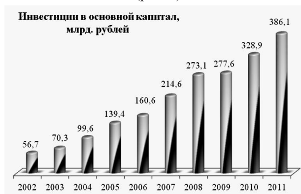
Рис. 1. Инвестиций в основной капитал за период с 2002 по 2011 гг.

Согласно статистическим данным, по объемам инвестиций в основной капитал Республика Татарстан за 2011 г. занимает лидирующее место среди регионов ПФО. Размер инвестиций в основной капитал составил 386,144 млрд. руб., что почти на 8 % выше значения 2010 г. (рис. 1).