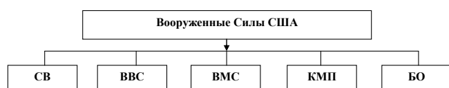
Схема 1 [5]

Первые четыре вида Вооруженных Сил (далее ВС) подчиняются Министерству обороны США. Береговая охрана (БО) в мирное время подчиняется Министерству национальной безопасности США, а в случаях начала военных действий – переходит в полное подчинение Министерства обороны. Вооруженные Силы состоят из регулярного и резервного компонентов. Резервные компоненты включают в себя резервы всех пяти видов вооруженных сил. Численность регулярных Вооруженных Сил США составляет более 1,3 млн. военнослужащих и 684 тыс. чел. гражданского персонала. Численность резервных компонентов – 1,1 млн. чел. Военнослужащие резервных компонентов непрерывно привлекаются к военной службе.