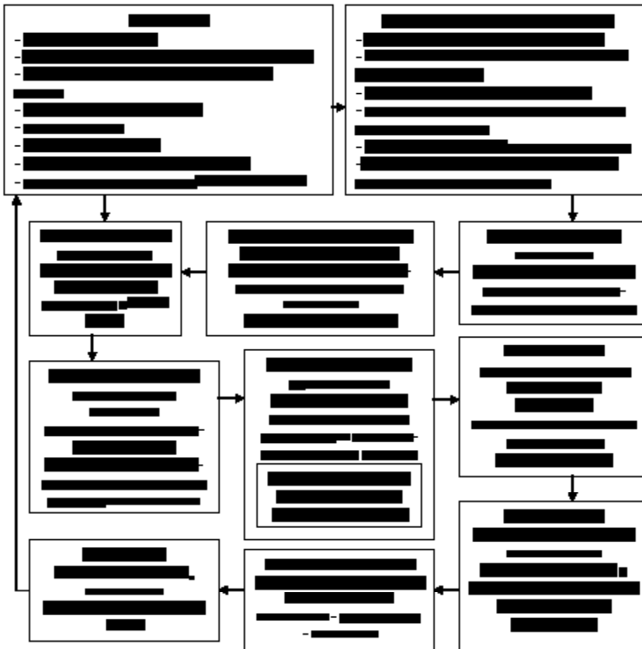
Рис. 2. Концептуальный подход к повышению конкурентоспособности ЖКХ через формирование идеологии рационального ресурсопотребления

– потенциал трудовых ресурсов, характеризующийся занятостью трудоспособного населения, предпринимательской способностью, квалификацией и уровнем образования, здоровьем и доходами;