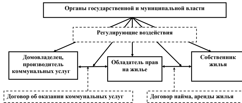
Рис. 1. Модель подсистемы, в которой законно осуществляются взаимодействия по предоставлению и получению жилищно-коммунальных услуг

собственности на него, предположим, что в России представления о собственности на жилищно-коммунальное хозяйство соответствуют прогрессивному опыту человечества. В этом случае подсистема субъектов, в которой осуществляются договорные отношения о предоставлении жилищно-коммунальных услуг, может быть представлена моделью, изображенной на рис. 1.